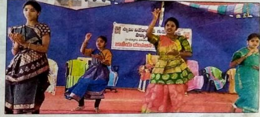
సాంస్కృతిక కార్యక్రమంలో విద్యార్థులు