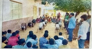
యోగాసనాలు నేర్చుతున్న గురుకులం విద్యార్థులు