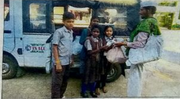
వేదలకు లన్నదానం చేస్తున్న విద్యార్థులు